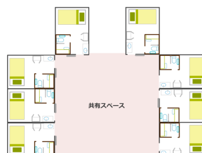
ユニット型個室 (居室面積基準…10.65㎡以上)

ユニット型特養で提供されるケアを“ユニットケア”と呼び、「家庭的な雰囲気の中で、個別性のある居室で、顔なじみの職員が身の回りのお世話をを行う。」という理念の下に生まれたサービスとなります。